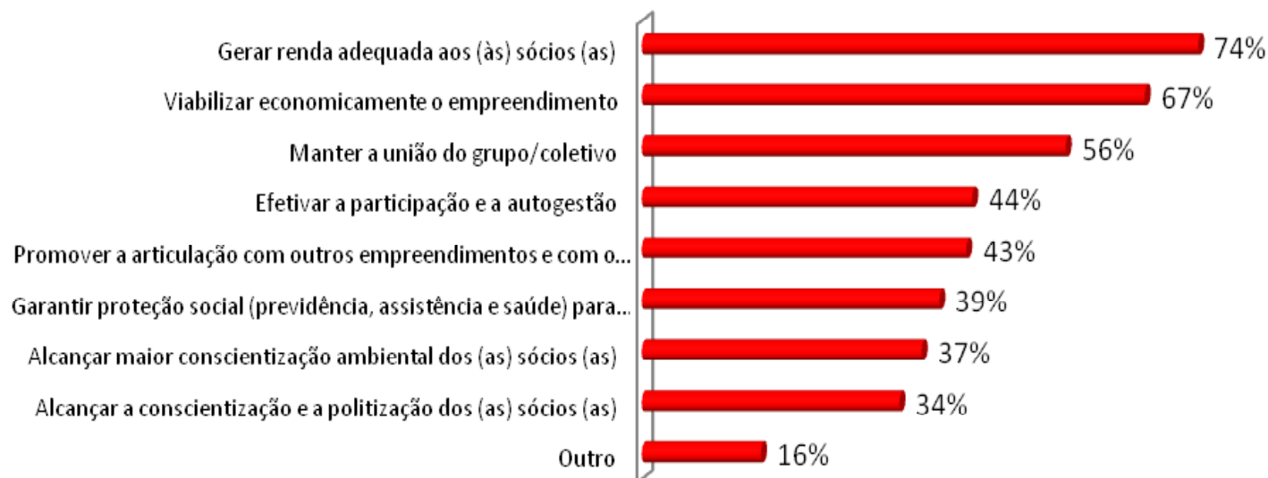
Gráfico 3 – Principais conquistas dos EES